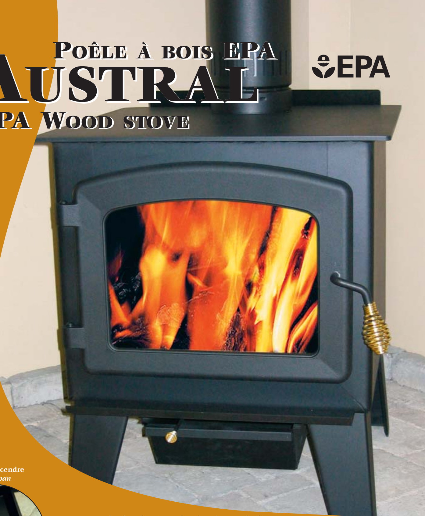
Tiroir à cendre Ash pan