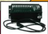
Ventilateur / Blower

Grande chambre à combustion / Large firebox